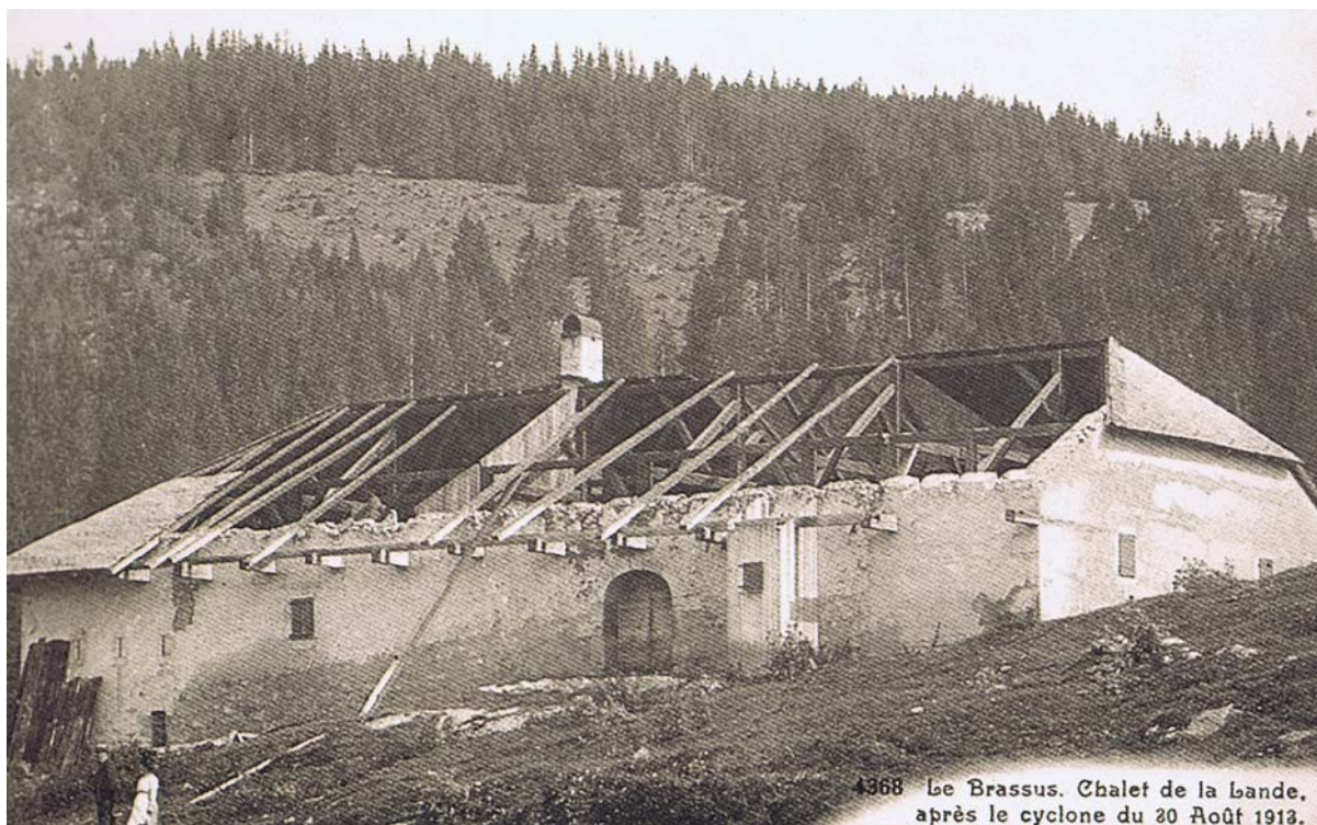
4368 Le Brassus. Chalet de la Lande, après le cyclone du 30 Août 1913.

On avait pu lire dans le journal Golay :